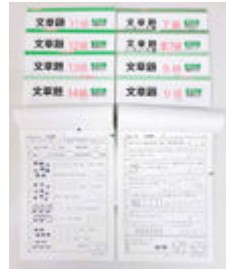
年長から小3までの「文章題」