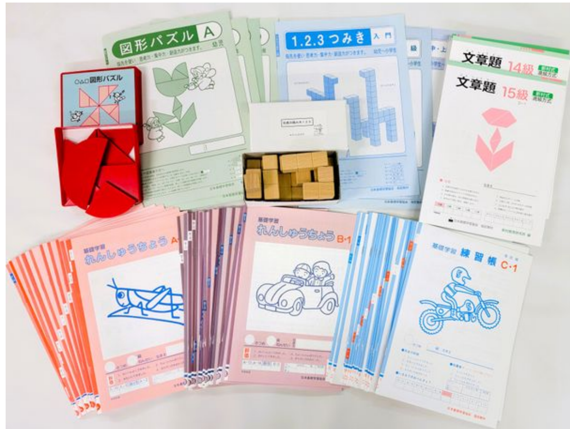
ほうかごエジソンボックス

ンボックス」(放デイ向け)「同プレップ」(児発向け)及びその構成要素である冊子教材等を販売していきます。