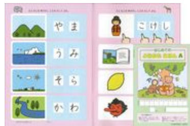
年中：よみかたえほんA