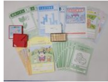
ほうかごエジソンボックス・プレップ