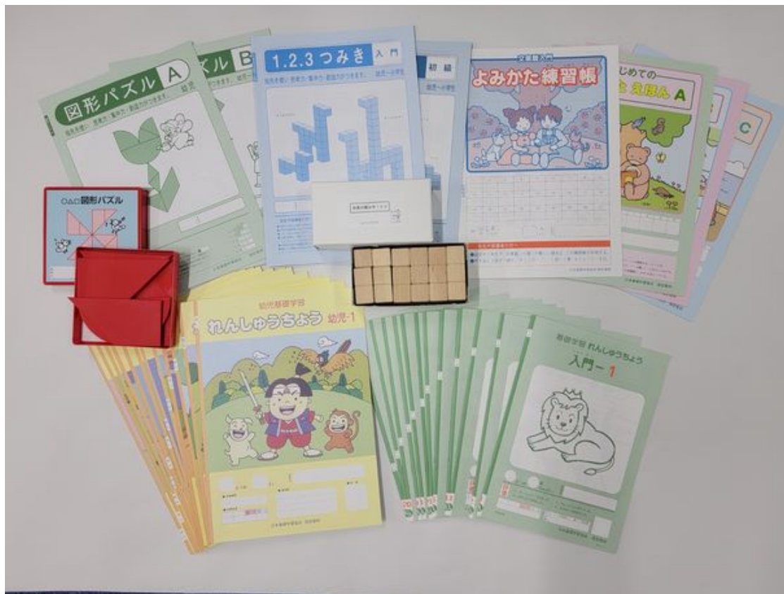
ほうかごエジソンボックス・プレップ