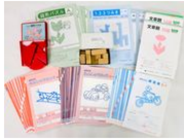
ほうかごエジソンボックス